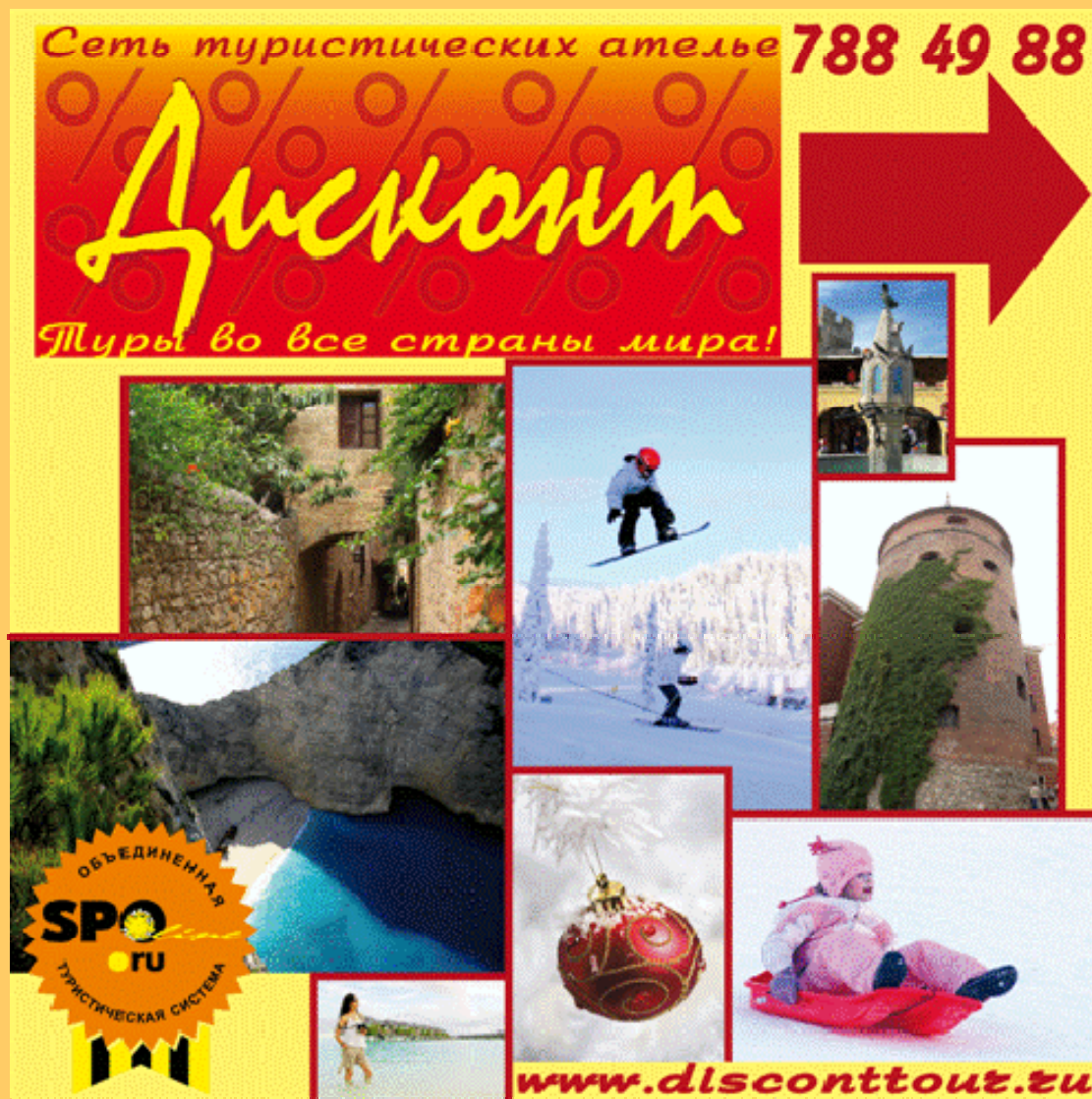
Плакат (разные размеры)